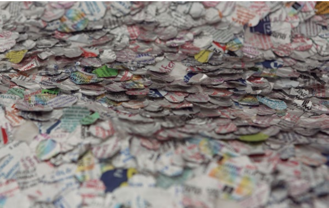
Piel | Objeto aéreo | Serie Curandera | Detalle