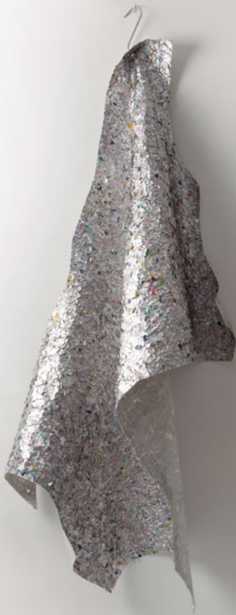
Piel | Objeto aéreo | Serie Curandera | Residuos metálicos de blíster de medicamentos adheridos sobre tela, y gancho metálico | 190 cm x 65 cm de diámetro, colgada, no lineales | 2014