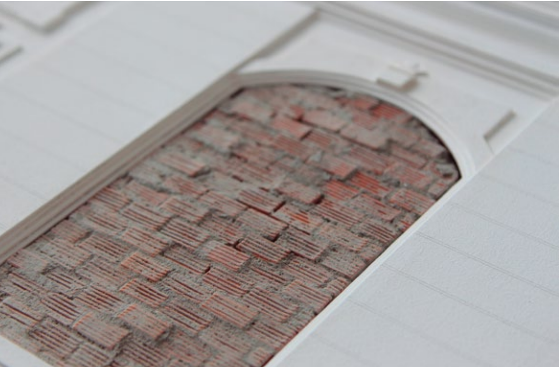
Tapiar Buenos Aires | Ignacio Unrein | Detalle