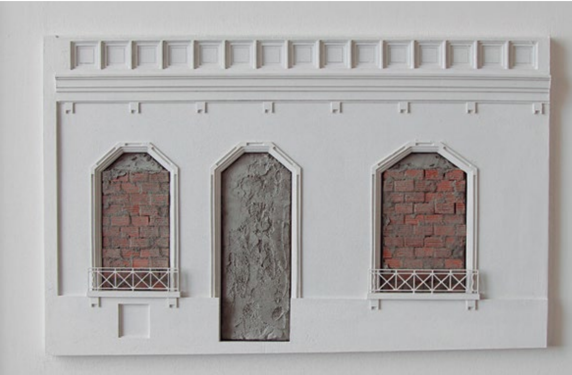
Tapiar Villa Urquiza (Rivera 5529) | Ignacio Unrein