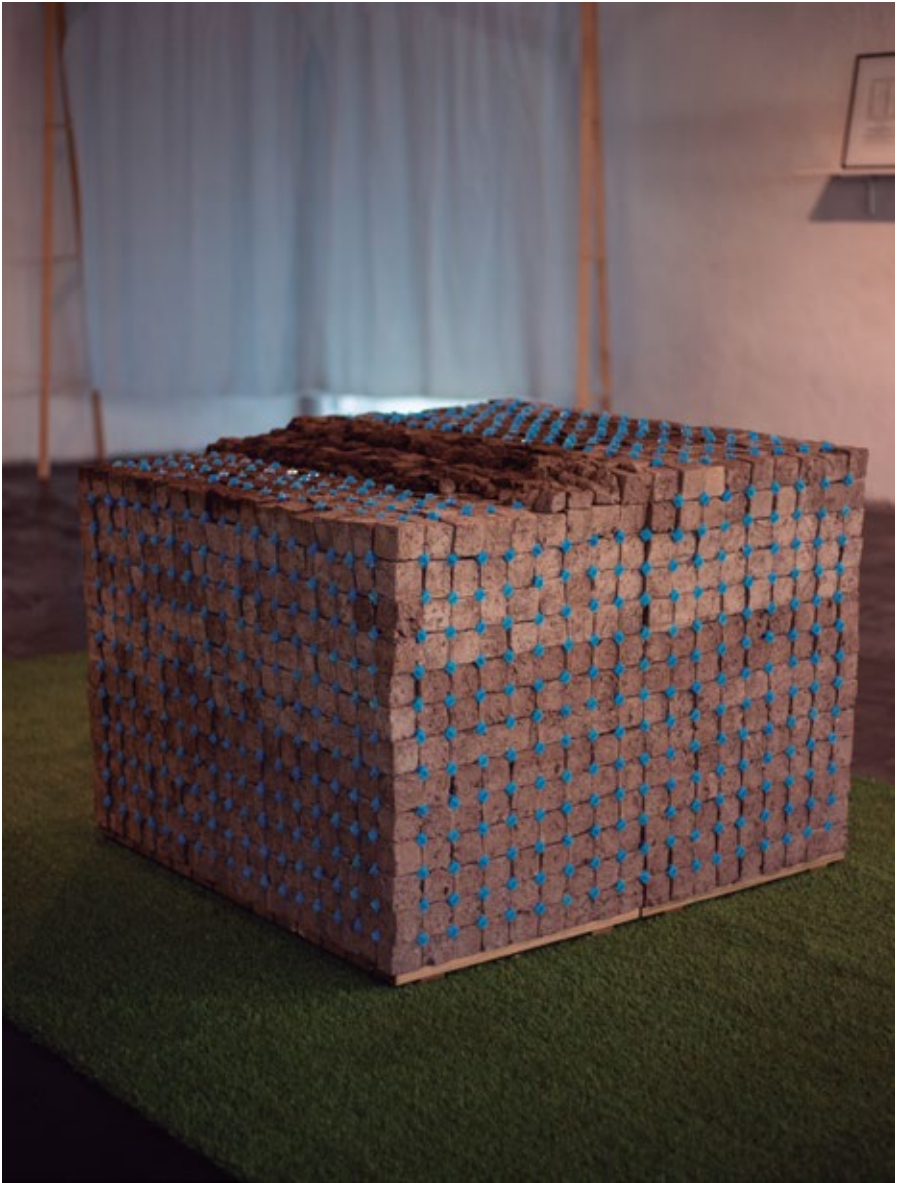
749.766M3 de Verano | Ignacio Unrein