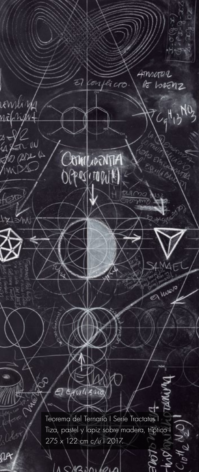
Teorema del Ternario I Serie Tractatus I Tiza, pastel y lapiz sobre madera, tríptico I 275 x 122 cm c/u | 2017.